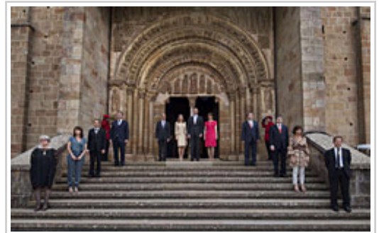
Gobernuo kideak eta Parlamentuko lehendakaria printze-printzesekin paratu dira "speciosa" deritzon atarian.

Iruñeko artzapezpikuak, eserita eskaini duen sermoian, esan du Leireko monasterioa Nafarroako erregeak gogoratu eta haien alde otoitz egiteko giro egokia dela, izan ere, "bere historia gogoratu eta ospatzen duen herria bizirik dagoen eta etorkizuna duen herria da", gehitu du.