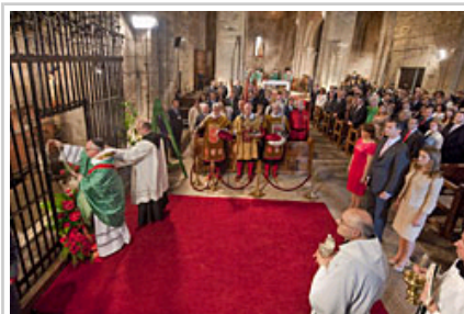
Errege Gorentasunak Nafarroako lehen Erregeen hilobiaren aurrean.