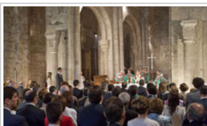
Errege Gorentasunak elizkizunaren buru izan dira.