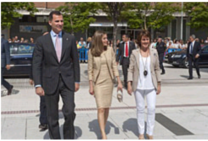
Errege Gontasunak Musikaren Hirira iritsi ondoren.