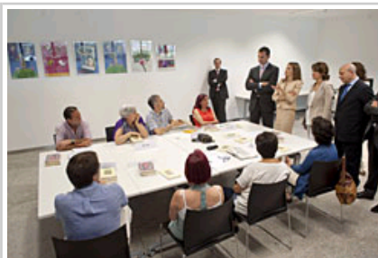
Errege Gontasunak irakurketa-klubeko kideak agurtzen.