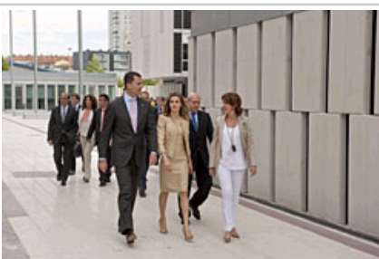
. Errege Gontasunak, Liburutegi eta Nafarroako Filmoteka aldera joaten.