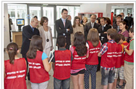
Errege Gontasunak biblioexploratzailen talde bat agurtzen.