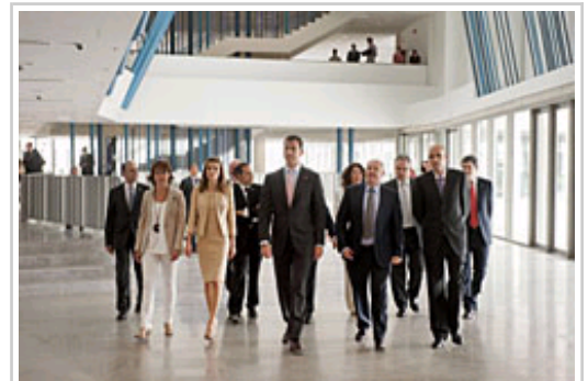
Errege Gorentasunak Liburutegia eta Nafarroako Filmoteka bisitatu.

Asturiasko eta Vianako printze-printzesa Errege Gorentasunek Nafarroara egindako bisitaren barnean, Kulturaren Vianako Printzea Saria Antonio López-i emateko ekitaldia eta Leireko San Salvador monasterioan Nafarroako Erregeei urtero egiten zaion omenaldia dela eta, gaur arratsaldez Musikaren Hiriko, Liburutegiko eta Nafarroako Filmotekako egoitzetara joan dira, Mendebaldea Iruñeko auzoaren alboko eraikinetan daudenak.