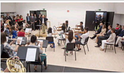
Errege Gontasunak orkestraren entsegua jarraitzen.