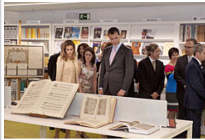
Errege Gontasunak liburutegia-mediatekaren erakusketa bisitatzen.