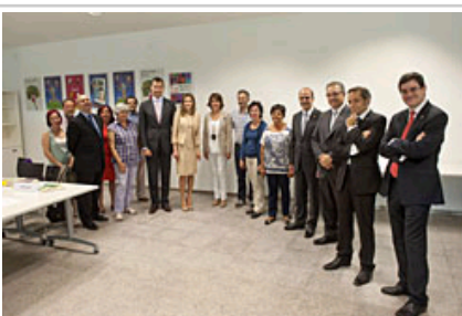
Errege Gontasunak irakurketa-