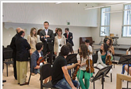
Errege Gontasunak orkestrako partaideak agurtzen.