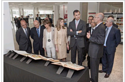
Errege Gontasunak Liburutegiko pieza-sorta bat bisitatzen.