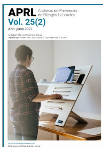
Archivos de Prevención de Riesgos Laborales