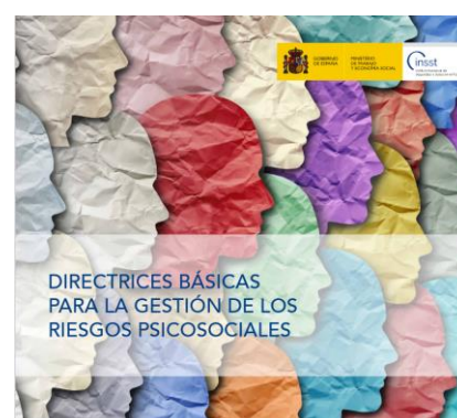
Directrices Básicas para la gestión de los riesgos psicosociales