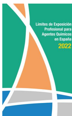
Límites de exposición profesional para agentes químicos en España