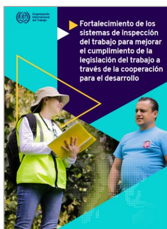
Fortalecimiento de los sistemas de inspección del trabajo