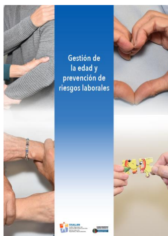
Gestión de la edad y prevención de riesgos laborales