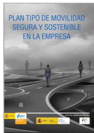
Plan Tipo de Movilidad Segura y Sostenible en la Empresa INSST/ DGT