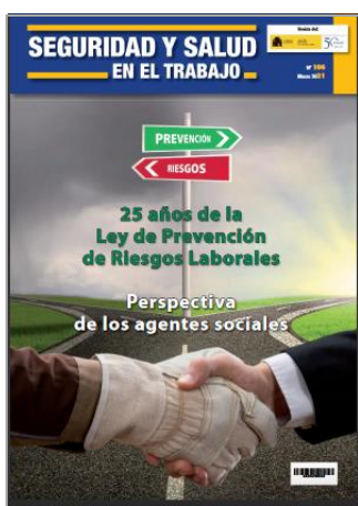
Revista Seguridad y Salud en el Trabajo - Número 106 INSST