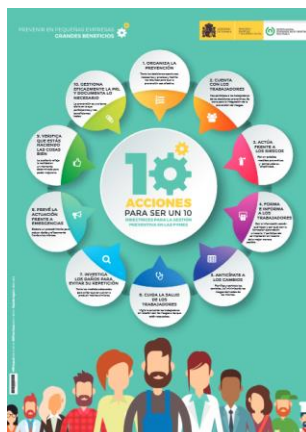
Directrices para la gestión preventiva en pymes INSST