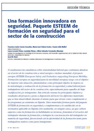
Paquete ESTEEM de formación en seguridad construcción INSST