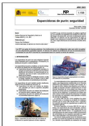
NTP 1156: Escarificadoras de purín: seguridad INSST