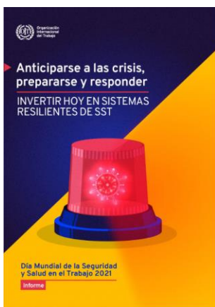
Anticiparse a las crisis, prepararse y responder OIT