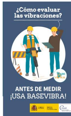
Folleto: Antes de medir ¡Usa Basevibra!