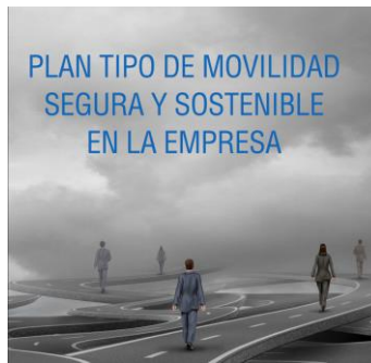
Plan Tipo de Movilidad Segura y sostenible en la empresa