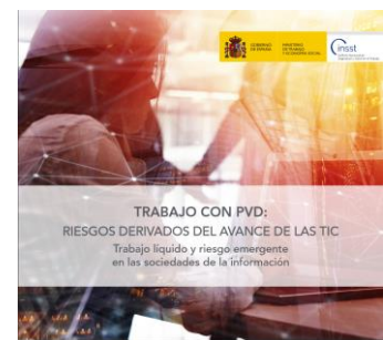
Trabajo con PVD: Riesgos derivados del avance de las TIC