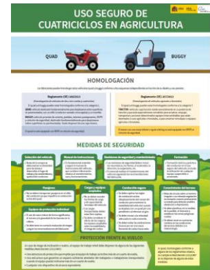
Uso seguro de cuatriciclos en agricultura. Póster