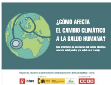
Guía orientativa de los efectos del cambio climático en la salud