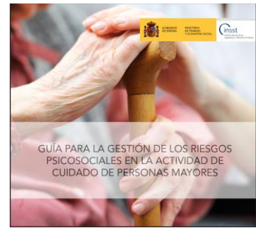
Gestión de los riesgos psicosociales en la actividad de cuidado de personas mayores