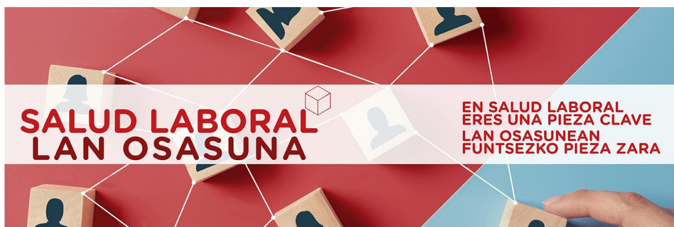
Imagen genérica de la edición 2021 de la campaña “En salud laboral eres una pieza clave”

Nueva edición de la campaña “En salud laboral, eres una pieza clave”. La campaña 2021 tiene como ejes centrales un vídeo genérico y la edición y distribución de 12.000 calendarios , 6.000 de pared y 6.000 de mesa, que se han repartido en 5.500 empresas de más de cinco trabajadores y trabajadoras.