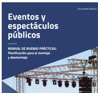
Eventos y espectáculos públicos. Manual de buenas prácticas. Montaje y desmontaje