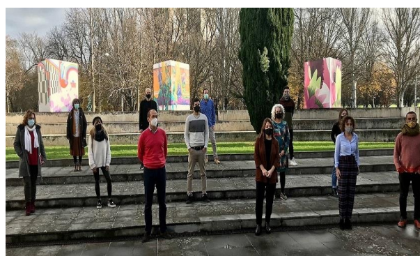
Representantes de las entidades organizadoras.

El tema genérico de esta edición ha sido la prevención de riesgos psicosociales y los trabajos lo han reflejado en situaciones ligadas a la igualdad de género, la igualdad por motivo intercultural, los buenos tratos y la situación generada por el COVID-19, abordada desde una óptica positiva.