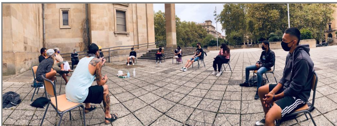
Estudiantes de Formación Profesional, durante una de las jornadas del proyecto 'Inspiratu'.

Prevención de riesgos laborales en el alumnado de FP. El Departamento de Educación y el Instituto de Salud Pública y Laboral de Navarra (ISPLN/NOPLI) continúan trabajando en la prevención de riesgos laborales con el alumnado de Formación Profesional. Así, ambas entidades colaboran este año 2020 en Inspiratu , un proyecto que une, a través del arte, el desarrollo personal, la educación y la inclusión social.