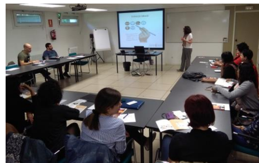
Sesión Formativa Delegados y Delegadas de PRL