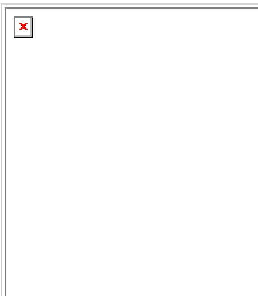
Exposición temporal "Carlismo a través del cine", que puede visitarse en el museo de Estella-Lizarra.

En la página web del Museo del Carlismo se publicarán las novedades relacionadas con la exposición y las actividades que se organicen: www.museodelcarlismo.navarra.es .