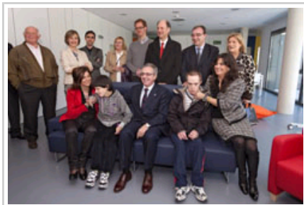
Las Hayas Desgaituen Arretarako Zentroa. Agintariak egoiliar eta profesional batzuekin.