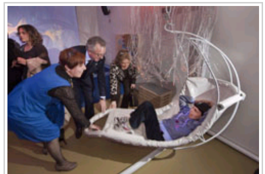
Las Hayas Desgaituen Arretarako Zentroa. Sanz Lehendakaria egoiliar batekin olgetan.