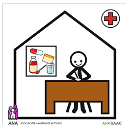
Pictograma que se instalará en los centros de salud.