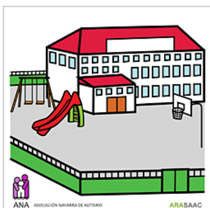
Pictograma que se instalará en los colegios e institutos.