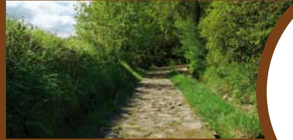
Tramo BERAMENDI-ALDATZ Tarte 5,2km.