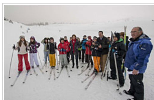
La Presidenta Barcina y el consejero Alli, con alumnos del colegio San Ignacio de Pamplona

La Presidenta de Navarra, Yolanda Barcina Angulo, ha visitado esta mañana las instalaciones de Belagua (Valle de Roncal), uno de los dos escenarios junto con el de Abodi (Valle de Salazar), en el que se desarrolla la campaña escolar de esquí de fondo, que cumple este año su trigésimo aniversario. A lo largo de su historia, más de 107.000 escolares navarros han participado en alguna de sus ediciones.