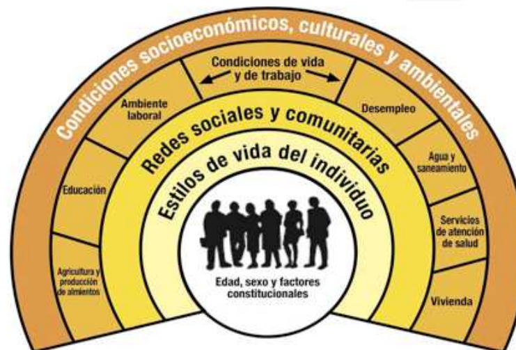
Figura 1. Modelo de determinantes sociales de la salud. Dahlgren y Whitehead, 1993