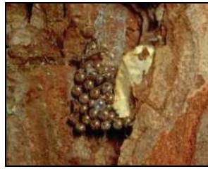
Puesta.