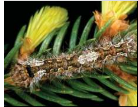
Aspecto de la larva.