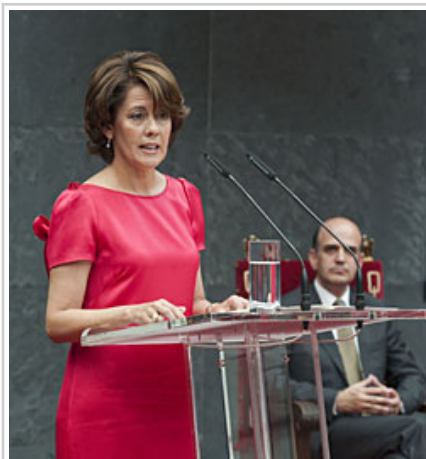
La Presidenta Barcina, durante su intervención.