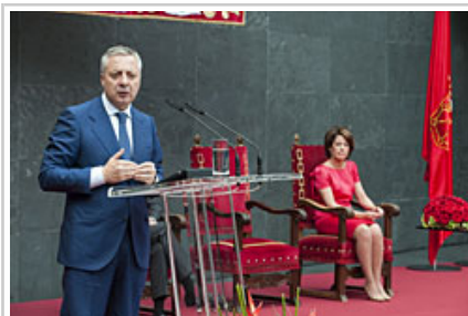
El ministro Blanco durante su discurso.