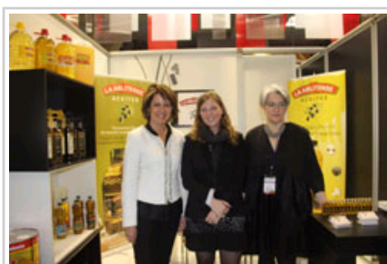
Aceites La Ablitense