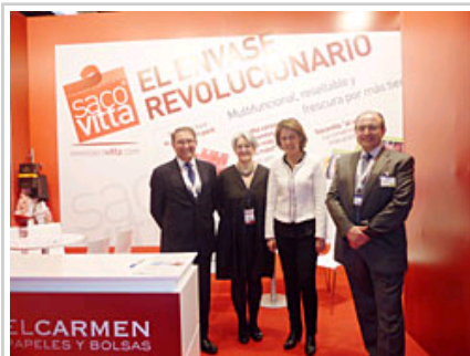
Papeles El Carmen