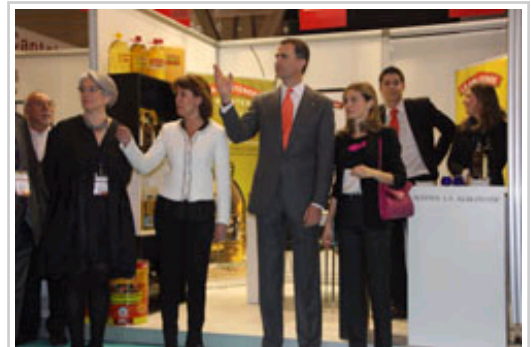
Llegada de los Príncipes de Asturias al stand de Navarra.

Los Príncipes de Asturias, Don Felipe y Doña Letizia, han visitado el stand de Navarra en la Feria Alimentaria de Barcelona, dentro del recorrido que han efectuado al recinto, después del acto de inauguración que ha tenido lugar a las 11 horas. La Presidenta del Gobierno de Navarra, Yolanda Barcina, ha atribuido la presencia de Navarra en la feria, con 49 empresas , a la importancia del sector agroalimentario en la Comunidad Foral, pues supone más del 6% de su PIB y en él desarrollan su actividad 1.200 empresas y 24.000 explotaciones agrarias, con un total de 28.000 personas empleadas y una facturación anual de 3.300 millones de euros.