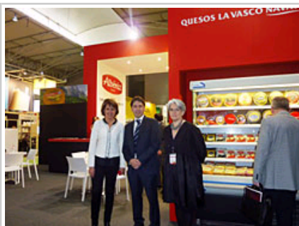
Quesos La Vasco Navarra