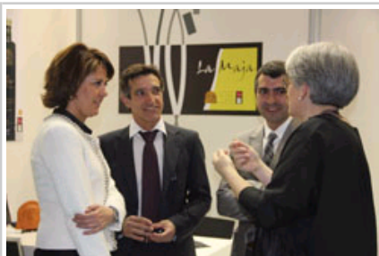
Agrícola La Maja