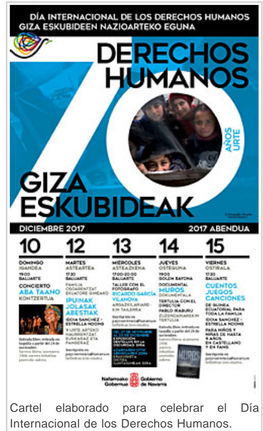
Cartel elaborado para celebrar el Día Internacional de los Derechos Humanos.

El ciclo dará comienzo el 27 de noviembre con la inauguración de la exposición “Destellos en la oscuridad” del fotoperiodista Ricardo García Vilanova que se podrá visitar en Baluarte hasta el 20 de diciembre. El resto de actividades se realizará entre los días 10 y 15 de diciembre.