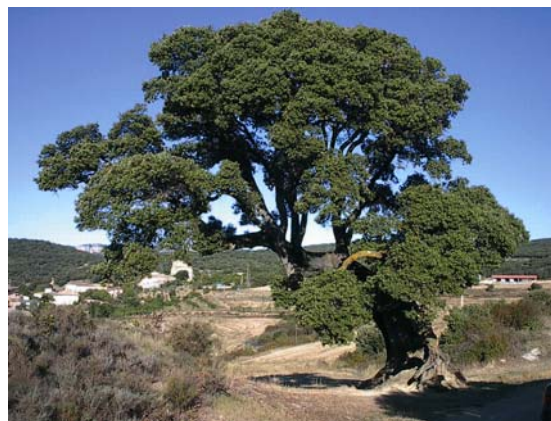
MN1 - Encina de Erául