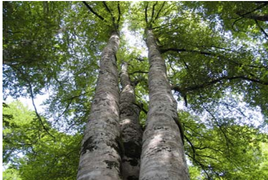
MN13 – Haya de los tres brazos