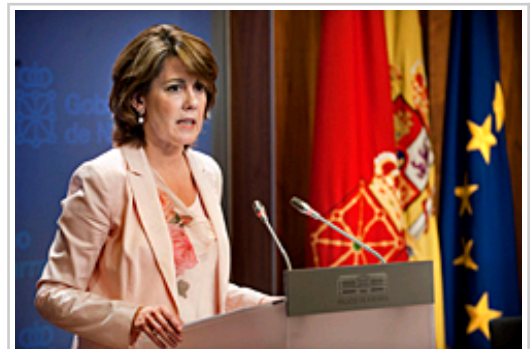
Barcina Lehendakaria, bere agerraldian.

Nafarroako Lehendakari Yolanda Barcinak azpimarratu du UPN eta PSNren arteko akordioaren aldeko apustua egiten jarraitzen duela, bart lehen lehendakariorde eta Lehendakaritzako, Administrazio Publikoetako eta Barneko kontseilari Roberto Jiménez kargutik kendu eta gero.