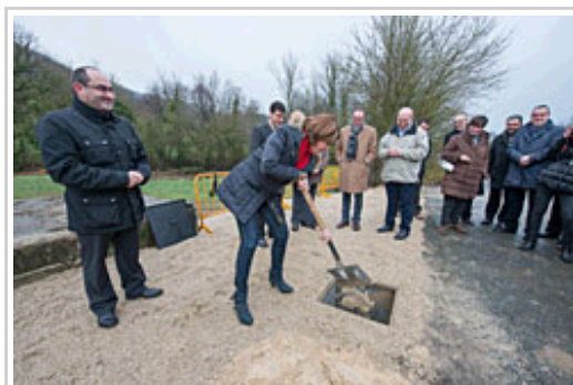
Barcina Lehendakaria Ultzanuetako uren sare berrirako lehen harria lurrez estaltzen.

Proiektuaren proposamena inguruko hainbat iturburu bateratuta eta aldi berean erabiltzea da, uraren ustiaketa zentzuzkoagoa eta orekatuagoa izan dadin eta, hala, agorraldian herrietako batzuk jasan izan duten defizita saihesteko. Asmoa inguruko baliabide hidriko garrantzitsuenak aprobetxatzea da, gainerakoa ubide naturaletatik ibil dadin,