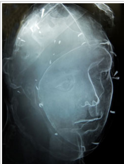
Los estudios muestran que algunos de los daños son irrecuperables.