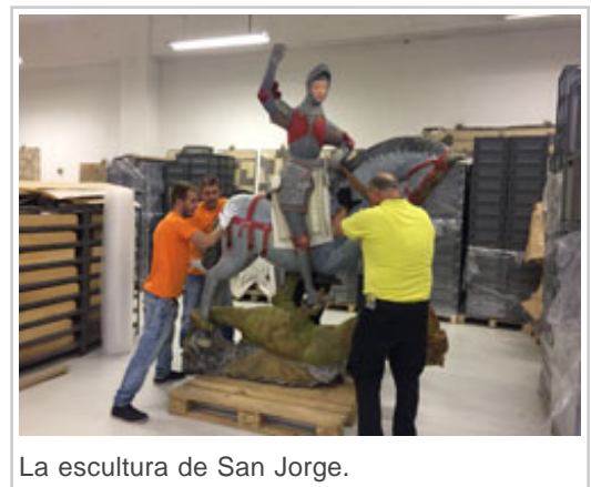
La escultura de San Jorge.