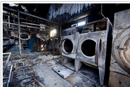
Maquinaria afectada por el fuego.