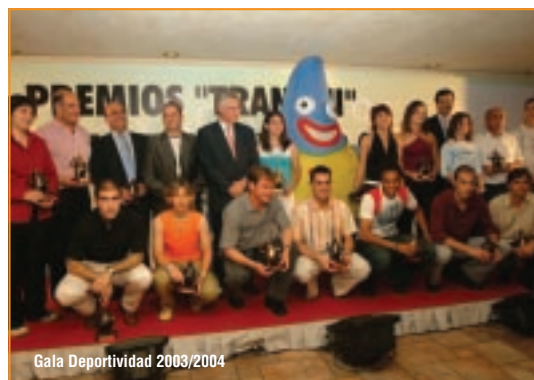
Gala Deportividad 2003/2004