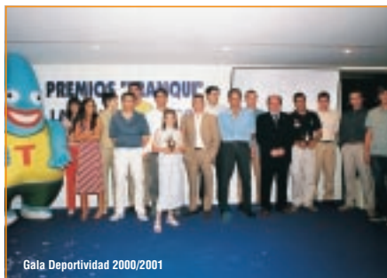
Gala Deportividad 2000/2001