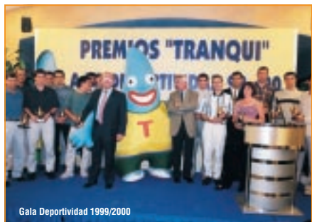
Gala Deportividad 1999/2000