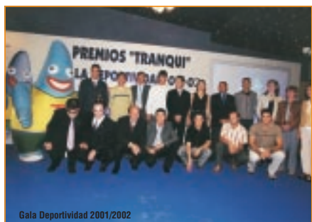
Gala Deportividad 2001/2002