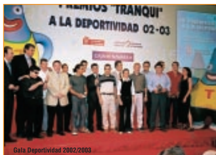
Gala Deportividad 2002/2003