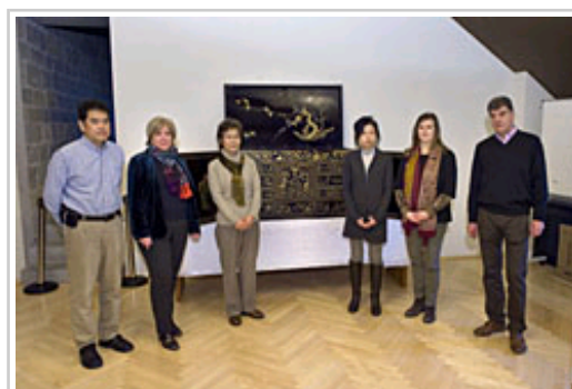
Responsables de Cultura, junto con los expertos japoneses en piezas namban.

Los expertos estudian ya el conjunto de trece obras de laca de importación de los siglos XVI, XVII y XVIII, pertenecientes a parroquias y conventos de Navarra y procedentes de Japón y del virreinato de Nueva España. Cabe señalar que Navarra conserva el mayor número de obras de toda España de estilo Namban, gracias, posiblemente, a la relación de San Francisco Javier y los Jesuitas con esta tierra.