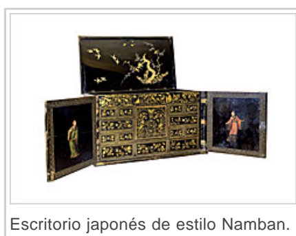
Escritorio japonés de estilo Namban.