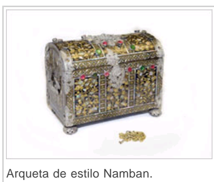
Arqueta de estilo Namban.