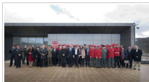
Imagen de las autoridades asistentes al acto

La Presidenta de Navarra, Yolanda Barcina Angulo, ha presidido esta mañana el acto de inauguración oficial de la nueva comisaría de Elizondo, desde la que la Policía Foral podrá atender a los 27 municipios que componen su área de influencia y a los 26.000 ciudadanos que la integran.