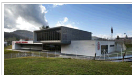
Comisaría de la Policía Foral en Elizondo.