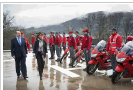
La Presidenta Barcina pasa revista a una formación de la Policía Foral.