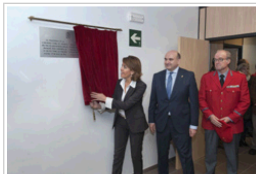
La Presidenta Barcina descubre la placa conmemorativa de la inauguración del edificio. Le acompaña el consejero Morrás y el jefe de la Policía Foral, Gerardo Goñi.

En concreto, la distribución de la superficie útil es la siguiente: almacén, 20,00 m; archivo, 18,20 m; área de descanso 5,00; armero, 9,50; aseos personal, 13,60; aseos público, 12,60; calabozos- control detenidos, 38,70; circulaciones, 51,60; cuarto de limpieza, 4,50; despacho jefe comisaría, 21,10; garaje, 461,9; oficinas atención ciudadana, 49,30; sala de espera, 24,80; sala de identificación, 22,20; sala de reuniones–briefing, 44,10; salas de trabajo, 122,20; vestíbulo, 12,50; vestuarios, 96,5.