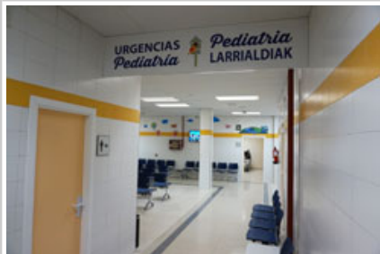
Acceso a las nuevas urgencias pediátricas de San Martín.