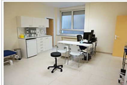
Una de las nuevas salas con que contarán las nuevas urgencias.