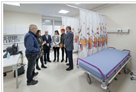
Un momento de la visita a las nuevas instalaciones.

La nueva zona de la cuarta planta dispone de 11 salas, cuatro de ellas consultas de Anestesia (dos